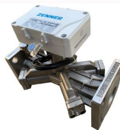
Flow Sensor IUF

For this application there are specific calculator types available. Please contact our sales department ( export.zenner.com@minol.intern ) for further information.